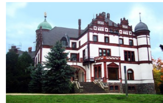
Terrasse Schloss Wiligrad - Fertigstellung 1997 Auftraggeber: LVVG Schwerin Arbeiten: Maurer-, Stahlbeton- und Putzarbeiten