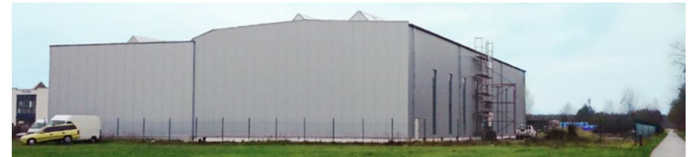
Erweiterung Produktions- u. Lagerhalle - Fertigstellung 2015 Auftraggeber: PS Fahling Fliesen u. Natursteine GmbH & Co.KG; Arbeiten: Mauer, Stahlbeton und Bewehrungsarbeiten