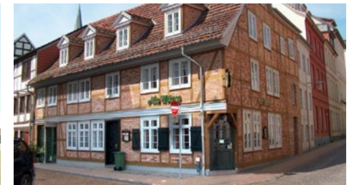
„Alte Münze“ Münzstraße in Schwerin - Fertigstellung 2001 Auftraggeber: BRS Bauregie Schwerin GmbH Arbeiten: Maurer-, Stahlbeton- und Putzarbeiten