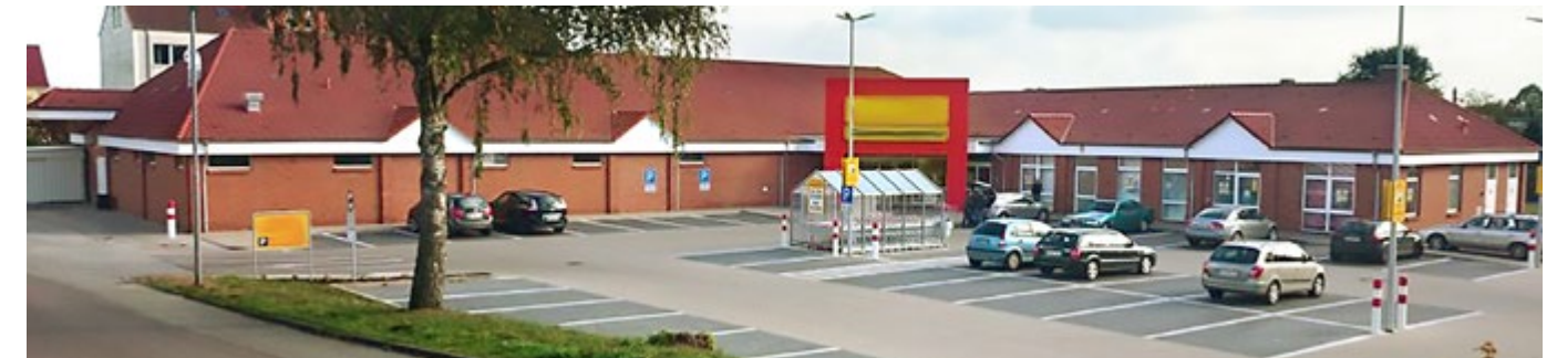
Umbau Verbrauchermarkt „Netto“ - Fertigstellung 2013 Auftraggeber: IGB Construct GmbH & Co.KG; Arbeiten: Mauer, Stahlbeton und Bewehrungsarbeiten

Der Bau von Industrie- und Gewerbeobjekten gehört zu den anspruchsvollsten Kategorien im Hochbau. Komplexe Aufgabenstellungen und hohe Vorgaben an die Umsetzung machen diese Projekte zu Herausforderungen, in denen immer wieder auch innovative Lösungen gefragt sind. Zum Beispiel geht es um die Frage, wie man Alltagstauglichkeit, Funktionalität und Ästhetik auf die jeweils beste Art kombinieren kann.