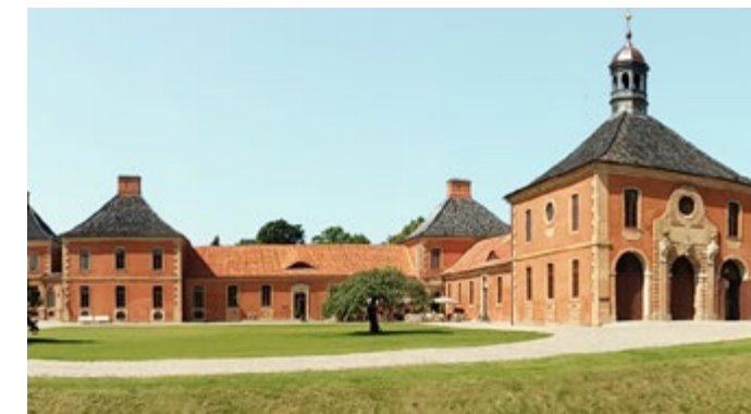
Sanierung Schloss Bothmer, Klütz - Fertigstellung 2016 Auftraggeber: BBL M-V Arbeiten: Maurer-, Stahlbeton- und Bewehrungsarbeiten, Fassadensanierung u. Unterfangungsarbeiten

Eines unserer Spezialgebiete sind historische Bauten. Als Mitglied in der Bauinnung „Bauhütte“ Schwerin sind wir kompetenter und gefragter Partner, wenn es um die Instandsetzung alter Bauwerke geht. Für solche Fälle haben wir erfahrene Mitarbeiter mit ganz speziellem Know-how. Dazu kommt eine gewissenhafte und detailgetreue Ausführung, mit der altehrwürdige Gebäude wieder in außergewöhnlichem Glanz erstrahlen.