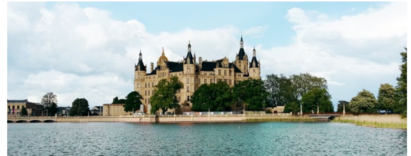
Sanierung Schweriner Schloss - Umbau Plenarsaal - Fertigstellung 2017 Auftraggeber: Landtag Mecklenburg-Vorpommern Arbeiten: Bewehrungsarbeiten, Stahlbetonbalken, Gründungsarbeiten, Sohle, Fundamente, Unterfangungen, Erdarbeiten